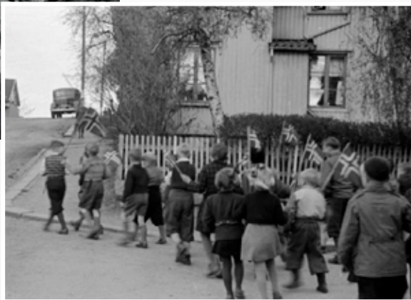
Fotograf Ragnar L. Larsen tok en rekke flotte bilder som beskriver frigjøringsdagene i 1945. Improvisert opptog med flagg i Fredrikstads gater på ettermiddagen 7. mai 1945. Nederst på Apenesfjellet mot Grønli, i krysset Apenesgata/Bryggeriveien.