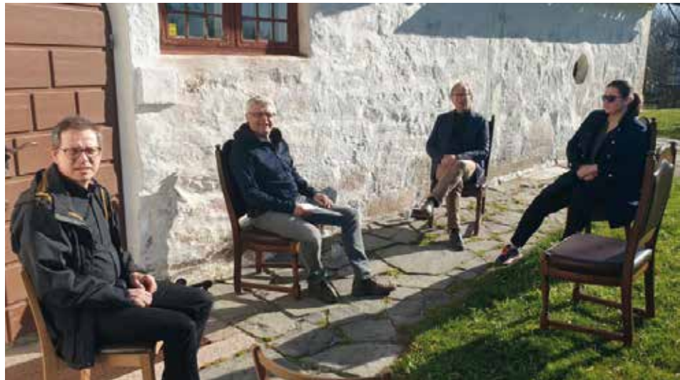
Stabsmøte i koronatid – når kontorene er stengt går det an å samles med sikker avstand utendørs.