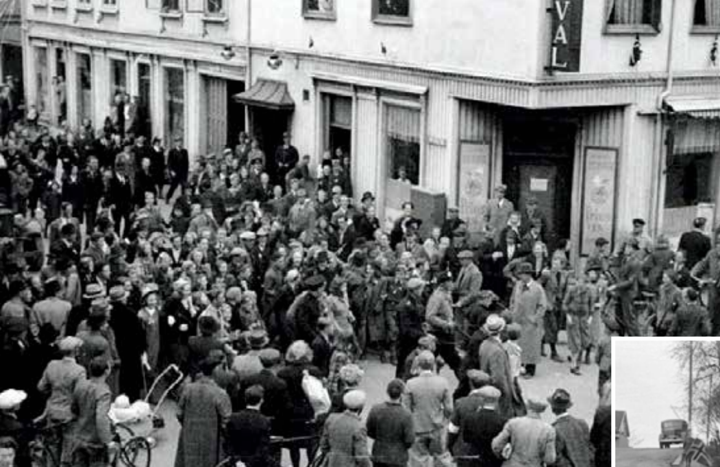
Frigjøringen i Fredrikstad: Bilder av gateliv tatt fra Hjemmefrontens kontor i 2. etasje i Folkets Hus på hjørnet av Glemmengaten/Glade Hjørne. Kafé Duval i bakgrunnen.