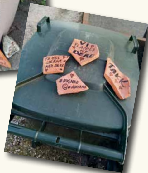
Hilsen til renovatørene som har vært på jobb hele tiden.